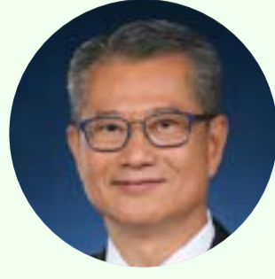
The Honourable Paul CHAN Mo-po, GBM, GBS, MH, JP 陳茂波先生, 大紫荊勳賢, GBS, MH, JP Financial Secretary, The Government of the Hong Kong Special Administrative Region 香港特別行政區政府財政司司長